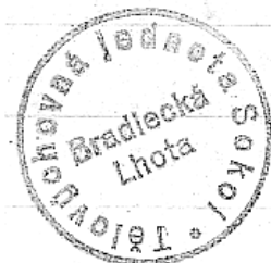
Razítka lhoteckého Sokola. (První se používalo v letech 1920-1952, druhé od r. 1952 a poslední od r. 1957)

4 ženy. Pokračovalo se i v pravidelných výletech. Počet členů Sokola začal opět stoupat a r. 1967 jich bylo 42. V této době byla nedílnou součástí činnosti Sokola i pomoc při práci v zemědělství a na obecních stavbách. Po kulturním domě se začalo budovat koupaliště a hřiště u KD. Do KD daroval OV ČSTV naší jednotě kruhy, střední bradla, kozu, pružný můstek a dva ribstoly. Zakoupena byla lavička. R. 1973 bylo dokončeno hřiště u KD a Sokol měl v té době 39 členů. R. 1975 přišel na hřiště antukový povrch a na spartakiádu nacvičovalo 10 žen, z nichž do Prahy jely 4. R. 1977 se vycházkami po okolí začal plnit odznak 100 jarních kilometrů a v zimě se konaly závody na lyžích. Od r. 1979 navázal Sokol na hraní divadla a děti nacvičily první pohádku. Koncem sedmdesátých let vznikl při Sokole oddíl stolního tenisu a zanedlouho začali muži hrát okresní soutěž. Počátkem osmdesátých let se k nim přidali i žáci a žákyně. Jejich družstva patřila k nejlepším v okrese, a tak na turnaje, které se ve Lhotě začaly pořádat, jezdili mladí hráči a hráčky z širokého okolí (účast bývala kolem 40 stolních tenistů). Začaly se také pořádat vánoční turnaje pro neregistrované hráče. Od r. 1979 pořádal Sokol na hřišti volejbalové turnaje. Na spartakiádu v r. 1980 nacvičovalo mladší žactvo a ženy a na tu v r. 1985 se do Prahy vypravily opět 4 ženy (celkem jich nacvičovalo 9). V roce 1986 se členská